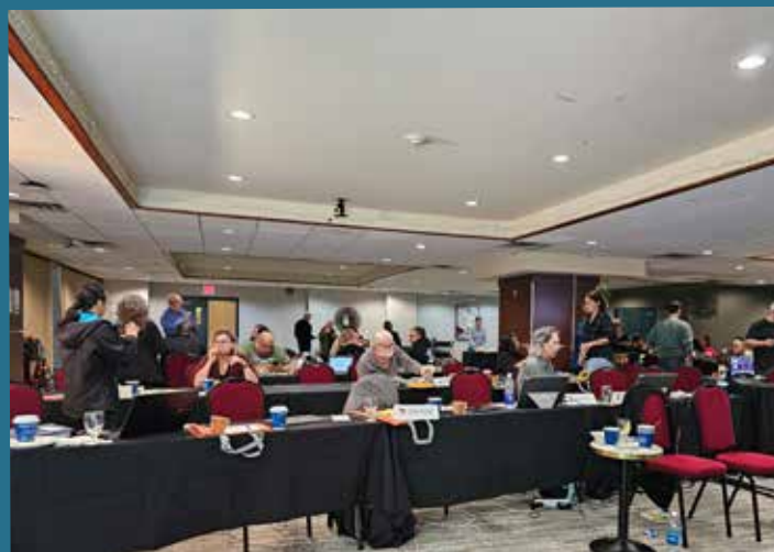
AGA de l'ASC à Victoria, C-B.