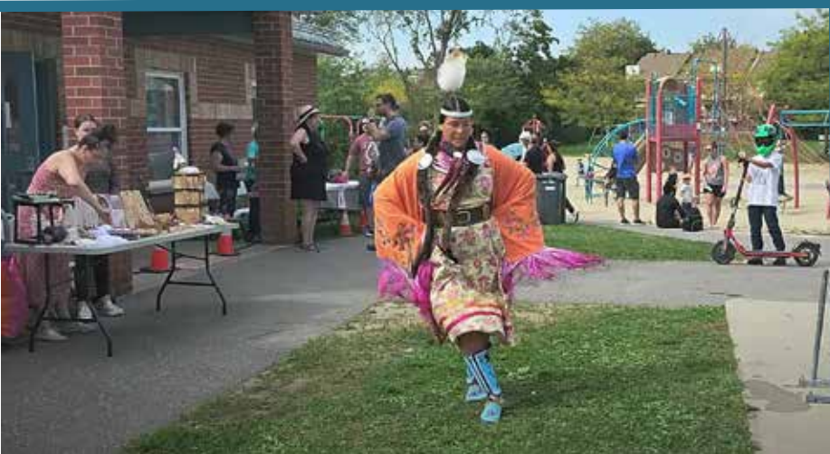
Fête de quartier