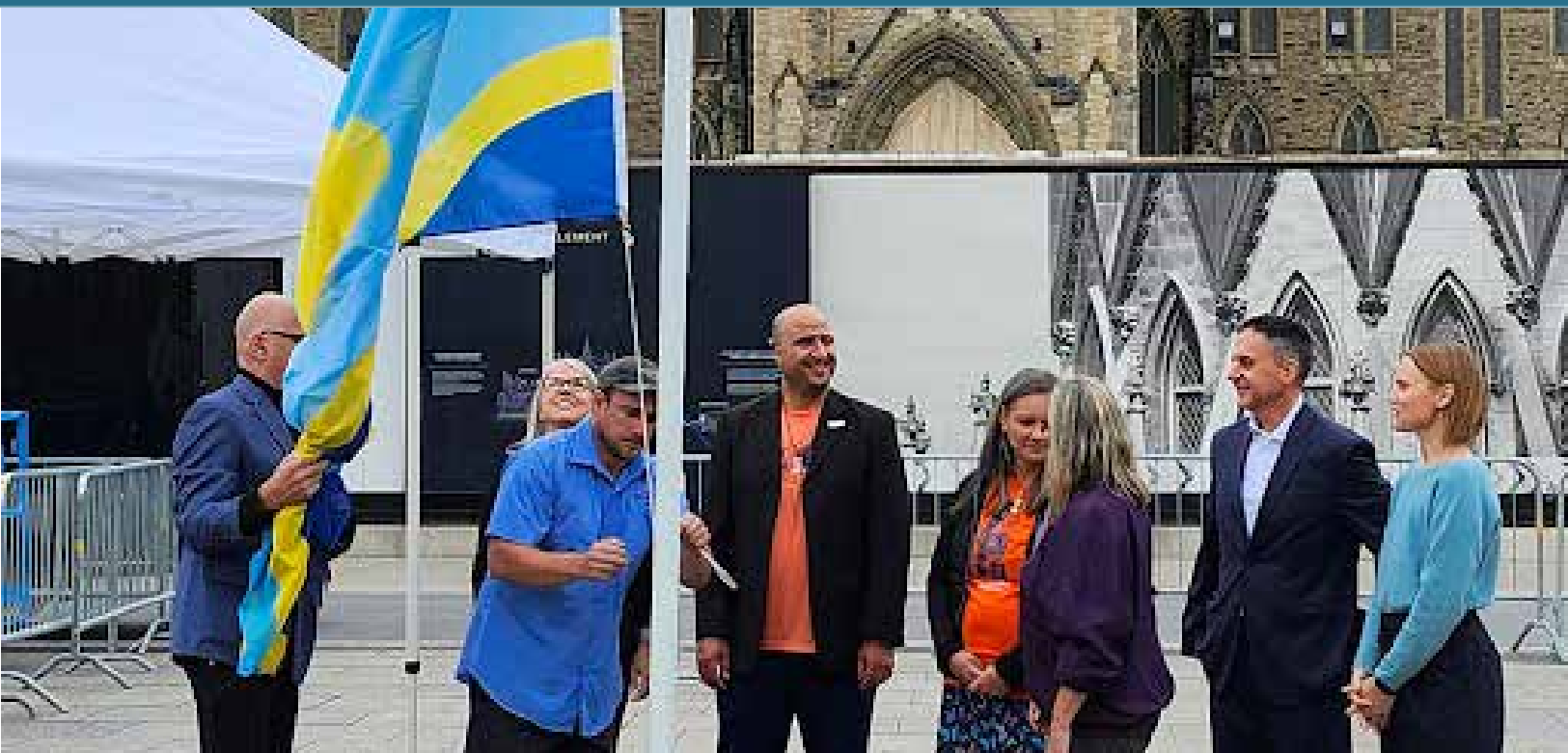
Journée internationale de la langue des signes